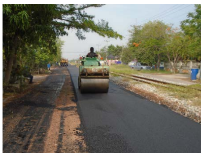
ก่อสร้างลาดยางแอสฟัลต์ติกคอนกรีตเลียบทางรถไฟ สายบ้านแหลม - แม่กลอง หมู่ที่ ๓