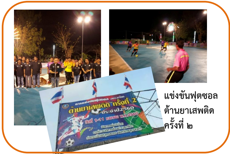
แข่งขันฟุตบอล ต.นยาเสพติด ครั้งที่ ๒