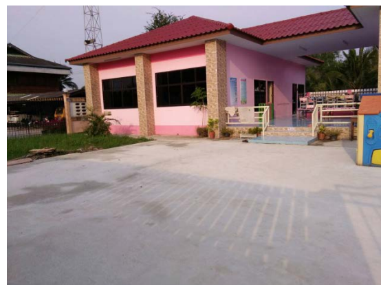
โครงการปรับปรุงศูนย์พัฒนาเด็กเล็กวัดปัจจันตาราม หมู่ที่ ๖