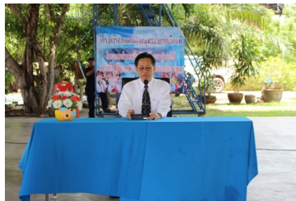
โครงการอำเภอเมืองสมุทรสาคร เคลื่อนที่