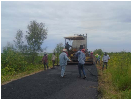
ก่อสร้างถนนลาดยางแอสฟัลต์ติกเข้าหมู่บ้าน หมู่ที่ ๑