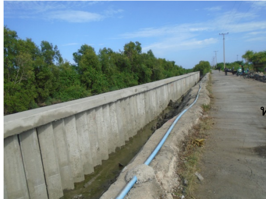
ก่อสร้างเขื่อน ป้องกันตลิ่งพัง เลียบบคลองนิคม ๒ หมู่ที่ ๕