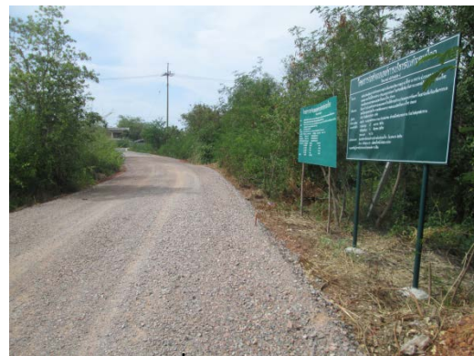
ก่อสร้างซ่อมเสริมถนนหินคลุกเข้าหมู่บ้าน เลียบคลองนิคม ๑ หมู่ที่ ๑