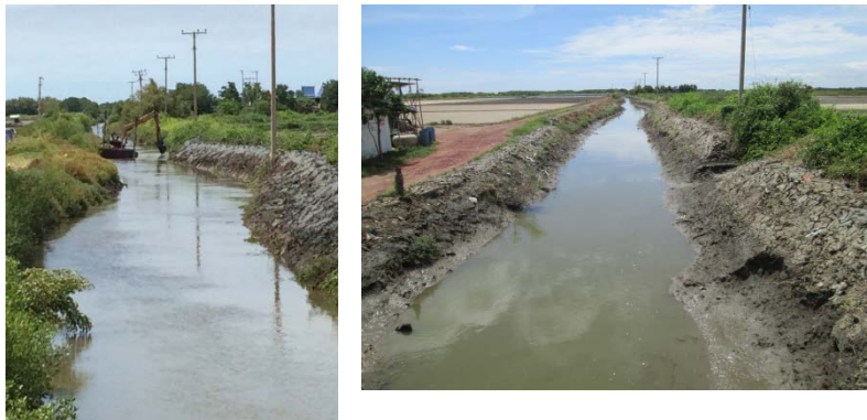
ขุดลอกคลองตาช้วน หมู่ที่ ๔