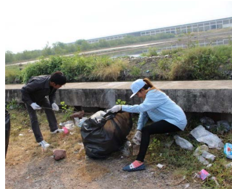
กิจกรรมเก็บขยะ