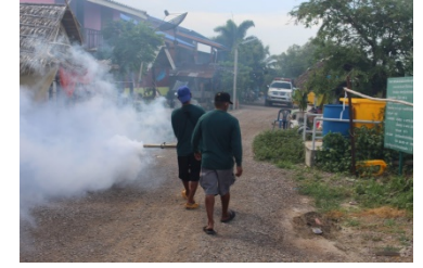
กิจกรรมพ่นควบคุมโรคไข้เลือดออก