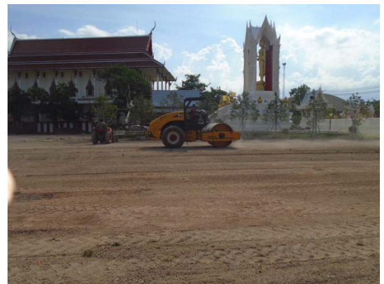
ก่อสร้างลาดยางแอสฟัลท์ติกลานเอนกประสงค์ หมู่ที่ ๒ (บริเวณหน้าหลวงพ่อสัมฤทธิ์องค์ใหญ่)