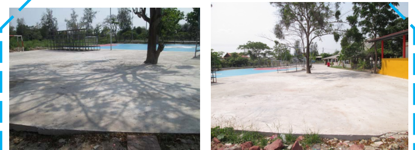
ก่อสร้างต่อเติมลานกีฬา คสล.ประจำหมู่บ้าน หมู่ที่ ๑