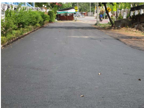
ก่อสร้างถนนลาดยางแอสฟัลท์ติกหน้าโรงเรียน วัดปัจจันตาราม หมู่ที่ ๖