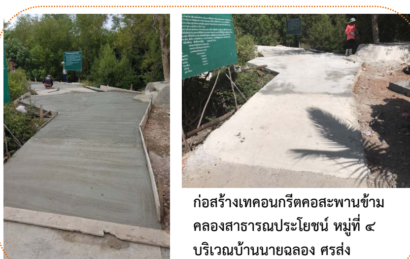
ก่อสร้างเทคอนกรีตคอสะพานข้าม คลองสาธารณสุขประโยชน์ หมู่ที่ ๔ บริเวณบ้านนายฉลอง ครสง