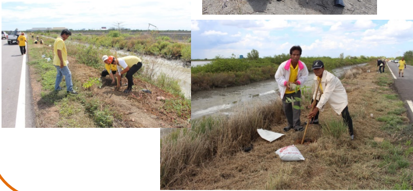
กิจกรรมปลูกต้นไม้