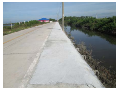
ก่อสร้างเขื่อนหินใหญ่เพื่อป้องกันตลิ่งพัง หมู่ที่ ๔ เลียบคลองรางจันทร์