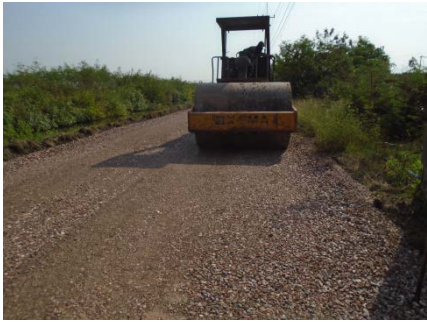
ก่อสร้างยกระดับถนน คสล. เข้าหมู่บ้าน หมู่ที่ ๖