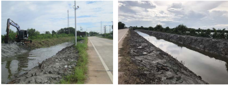
ขุดลอกคลองเลียบบถนนเอกชัยทั้งสองฝั่ง หมู่ที่ ๖