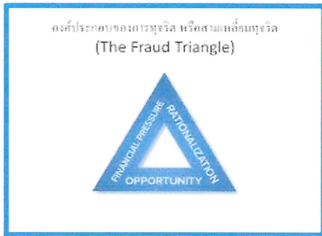
รูปภาพสามเหลี่ยมทุจริต (The Fraud Triangle)

๕. ขอบเขตประเมินความเสี่ยงการทุจริต แบ่งออกเป็นประเภทความเสี่ยงการทุจริต ออกเป็น ๓ ด้าน ดังนี้