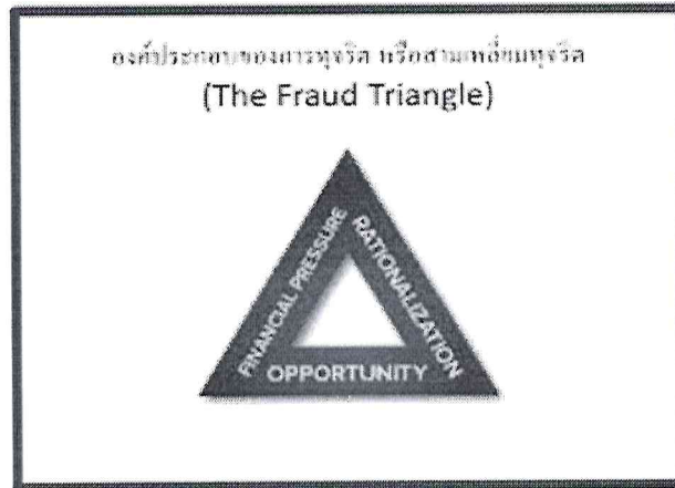
รูปภาพสามเหลี่ยมทุจริต (The Fraud Triangle)

๕. ขอบเขตประเมินความเสี่ยงการทุจริต แบ่งออกเป็นประเภทความเสี่ยงการทุจริต ออกเป็น ๓ ด้าน ดังนี้