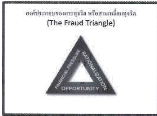
รูปภาพสามเหลี่ยมทุจริต (The Fraud Triangle)

๕. ขอบเขตประเมินความเสี่ยงการทุจริต แบ่งออกเป็นประเภทความเสี่ยงการทุจริต ออกเป็น ๓ ด้าน ดังนี้